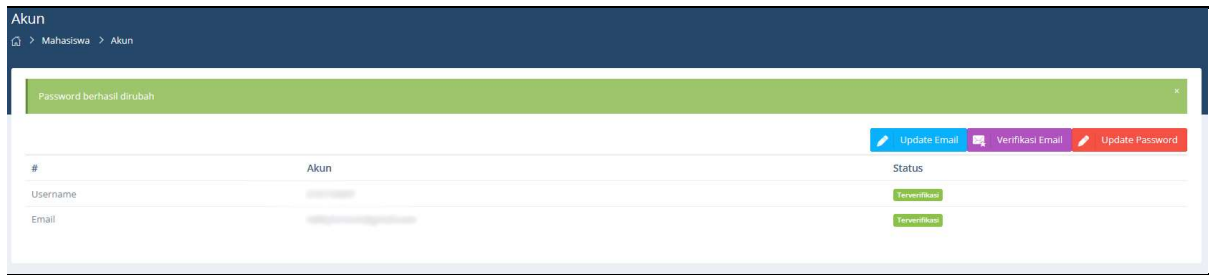
Gambar 5 Password Berhasil Diupdate