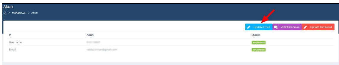
Gambar 2 Menu Akun Siakad